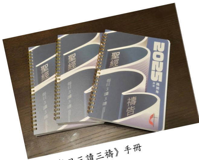
2025《每日三讀三禱》手冊

請直接使用郵政劃撥帳號 19342390「財團法人中華基督教衛理公會衛理神學研究院」並且請於備註欄加註「為三讀三禱奉獻」。